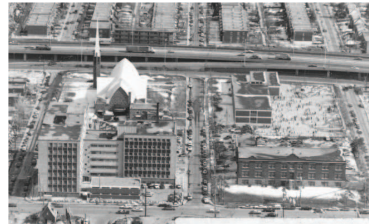
Une partie du noyau institutionnel de Ville Saint-Michel avec l'hôpital Saint-Michel, l'église Saint-Bernardin-de-Sienne, l'école Saint-Bernardin et l'académie Bélair circa 1982.