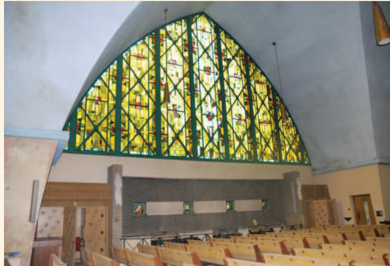
Verrière du transept ouest