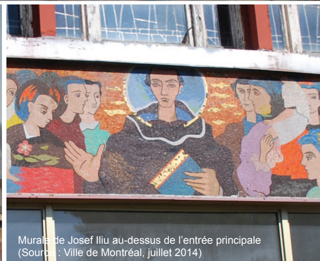
Murale de Josep Iliu au-dessus de l'entrée principale