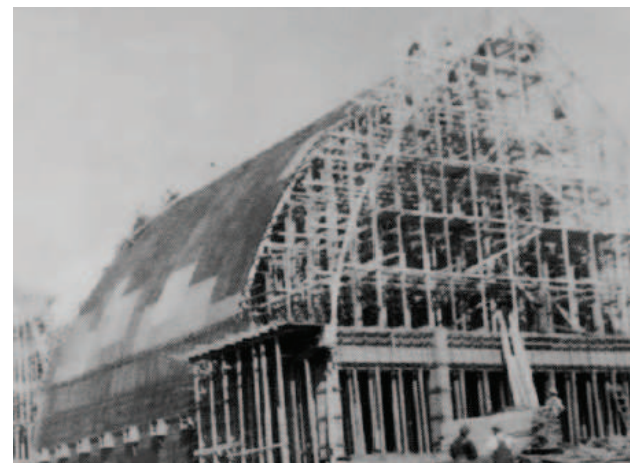
Au cours de la construction.