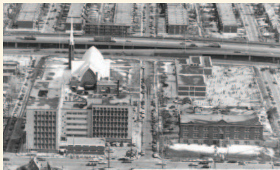
Une partie du noyau institutionnel de Ville Saint-Michel avec l'hôpital Saint-Michel, l'église Saint-Bernardin-de-Sienne, l'école Saint-Bernardin et l'académie Bélair circa 1982

La valeur historique du site de l'église Saint-Bernardin-de-Sienne repose sur son témoignage :