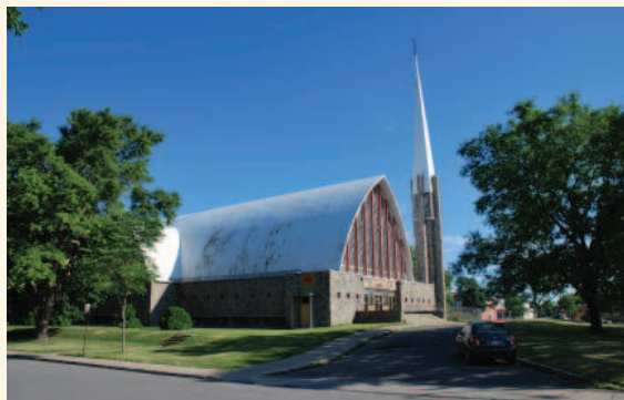
L'église vue depuis l'angle de la 8 e avenue et du boulevard Crémazie