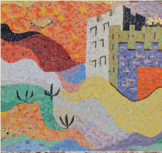
Détail d'une des murales de Josef Iliu, au-dessus de l'entrée principale de l'église