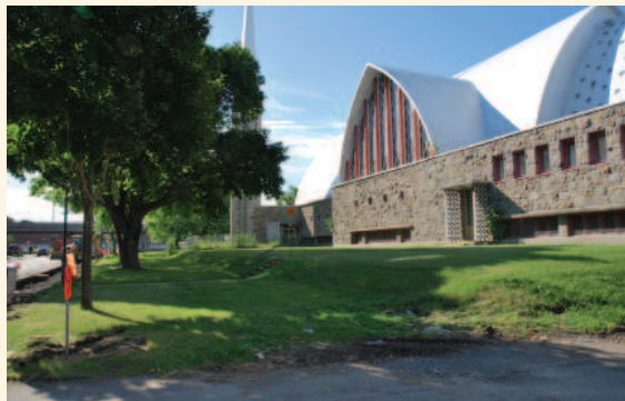
Talus et espace gazonné côté est

La valeur paysagère du site de l'église Saint-Bernardin-de-Sienne repose sur :