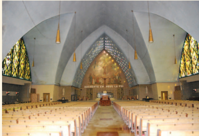
Nef, vue vers le chœur (Source : Ville de Montréal, juillet 2014)