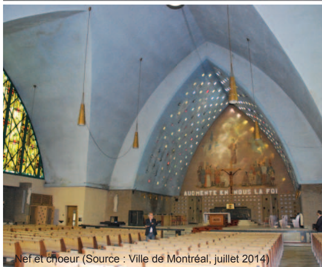
Nef et chœur