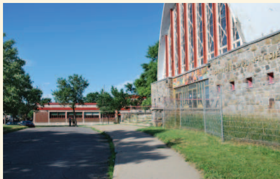
L'église et l'école Saint-Bernardin