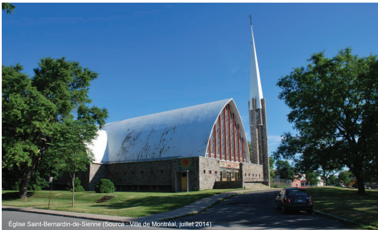
Église Saint-Bernardin-de-Sienne

Enfin, ce site revêt un intérêt historique puisqu'il témoigne de l'importante vague de construction d'églises à Montréal suivant la Seconde Guerre mondiale, de l'évolution de l'architecture religieuse (catholique) au Québec dans les années 1950-1960, du développement de la ville de Saint-Michel et de son importante croissance démographique au milieu du XX e siècle.