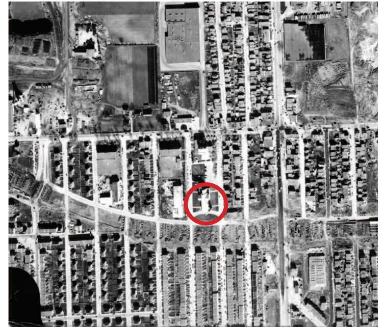
Photographie aérienne de 1958, l'église est encerclée en rouge.