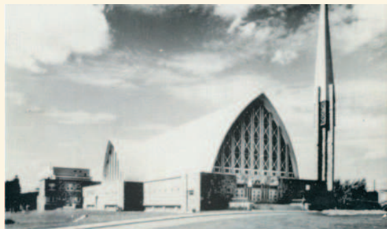
L'église à la fin des années 1950 sans son aménagement paysager et ses protections aux entrées latérales (Source : Communauté chrétienne de St-Bernardin-de-Sienne : ensemble, 1912-1987, (page couverture))