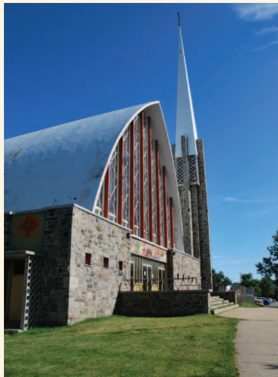
Façade de l'église Saint-Bernardin-de-Sienne