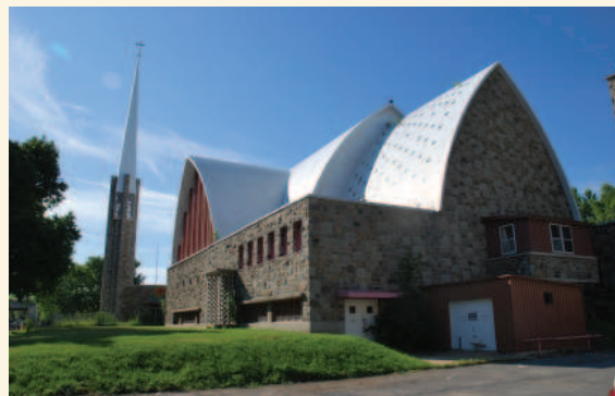
Vue arrière de l'église

La valeur artistique et architecturale de l'église Saint-Bernardin-de-Sienne repose sur :